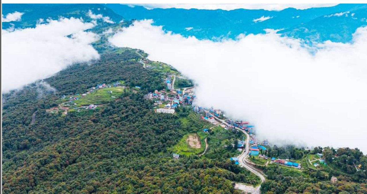
बादलु,छोप्यौ नी मलाई :गोरखाको अजिरकोट गाउँपालिका वडा नं. ३ मा अवस्थित सिरानडाँडाबाट देखिएको बादलको घुम्टोले छोपिएको भच्चेक बजार र आसपासको दृश्य । छिनमै बदलिरहने मौसमले यस स्थानमा पर्यटकहरु आउने गर्दछन् ।